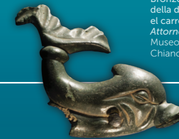
Bronzetto di delfino della decorazione del carro di Selene-Luna Attorno IV secolo a.C. Museo Civico Archeologico, Chianciano Terme

La nuova mostra Etruschi e Veneti. Acque, culti e santuari , ospitata nelle sale dell'Appartamento del Doge a Palazzo Ducale dal 6 marzo al 29 settembre 2026, prende avvio dal tema del sacro nel mondo etrusco per analizzare le molteplici declinazioni e manifestazioni del culto legate alle acque.