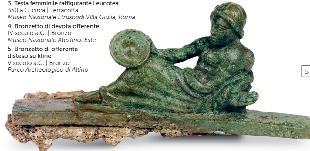
5. Bronzetto di offerente disteso su kline V secolo a.C. | Bronzo Parco Archeologico di Altino